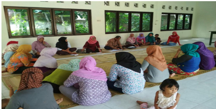
Gambar 2 Kegiatan Diskusi