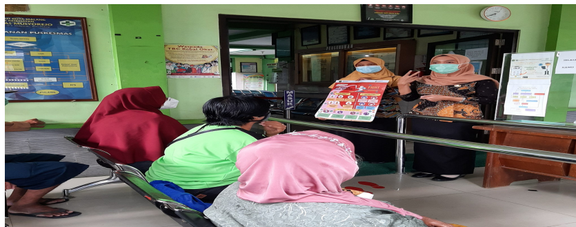
Gambar 1 Kegiatan Pemberian Pendidikan Kesehatan

Sikap terhadap perilaku SADARI menunjukkan bahwa sikap wanita tidak mempengaruhi pembentukan perilaku SADARI. Analisis data mengungkapkan bahwa mayoritas responden, yaitu memiliki sikap positif terhadap SADARI. Sebagian besar responden setuju bahwa SADARI merupakan salah satu metode untuk deteksi dini kelainan pada payudara. Sikap WUS terkait pentingnya menjaga kesehatan organ tubuh dapat membantu meningkatkan kesadaran akan pentingnya pencegahan risiko kanker payudara. Selain itu sikap dapat membantu meningkatkan motivasi pembelajaran sekaligus bisa mempraktekkan Sadari dalam kehidupan sehari-hari. Adanya sikap dapat melahirkan kebiasaan baru dalam mengamati ada atau tidak ketidaknormalan yang terjadi di payudara sendiri(5). Sehingga resiko kanker payudara dapat segera terdeteksi pada WUS.