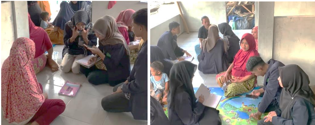
Gambar 5. Konseling dalam kelompok-kelompok kecil pada ibu hamil dan menyusui pada pertemuan ke-2

mitos-mitos pemeliharaan kesehatan pada masa kehamilan dan menyusui, serta berkembangnya perilaku pragmatis masyarakat dalam pemenuhan kebutuhan hidup. Disrupsi modal sosial masyarakat desa mengakibatkan keluarga 1000 HPK kurang berdaya dalam pemeliharaan masa kehamilan, menyusui dan perawatan anak yang potensal kearah gizi kurang/stunting pada anak (Thamrin, H., at. al, 2021). Hal senada juga diungkapkan oleh Malonda, dkk. (2021) dalam penelitiannya menjelaskan bahwa peningkatan pengetahuan ibu hamil dan menyusui terhadap pentingnya MP ASI dan pemanfaatan pangan lokal yang dapat menunjang pemenuhan gizi dan nutrisi pada ibu hamil dan anak untuk mencegah terjadinya stunting (12).