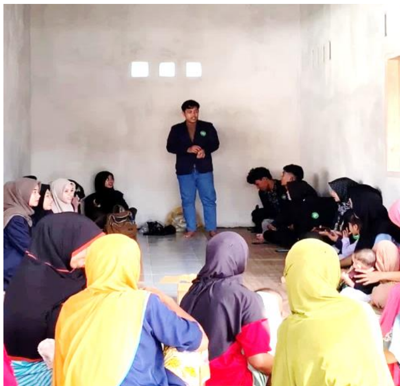
Gambar 3. Pemberian materi penyuluhan tentang pentingnya pemenuhan nutrisi pada ibu hamil dan menyusui, serta jenis makanan yang baik untuk ibu hamil dan menyusui

Hasil pelaksanaan kegiatan pendidikan kesehatan tentang pengaruh budaya pantangan makanan pada ibu menyusui terhadap kejadian stunting dan pentingnya pemenuhan kebutuhan gizi dan nutrisi yang seimbang dalam mencegah kekurangan gizi pada bayi dan balita di Dusun Batu Tinggang Desa Labulia. Kegiatan ini berjalan dengan lancar dan penuh semangat dari para peserta yang hadir.