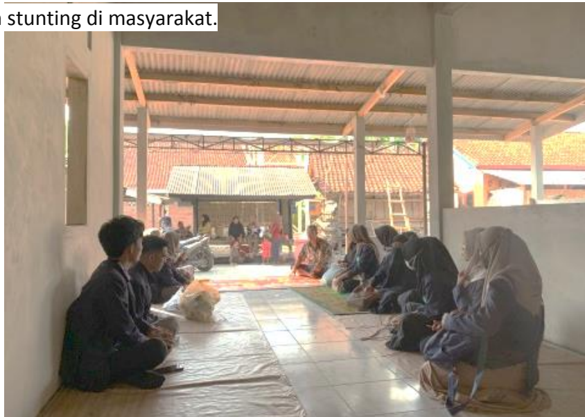
Gambar 2. Rapat Koordinasi dengan kepala dusun dan kader kesehatan di Dusun Batu Tinggang Desa Labulia

Kegiatan pengabdian masyarakat ini bertujuan untuk meningkatkan pengetahuan masyarakat tentang pengaruh budaya pantangan makanan pada ibu menyusui terhadap kejadian stunting. Melalui pendekatan pengabdian masyarakat, diharapkan informasi yang diperoleh dari pengabdian ini dapat disampaikan secara efektif kepada masyarakat. Pengabdian masyarakat menjadi pendekatan yang tepat dalam menanggulangi masalah ini. Dengan melibatkan segenap unsur masyarakat mulai dari kepala dusun, kader hingga masyarakat itu sendiri secara langsung, diharapkan informasi yang disampaikan dapat lebih mudah diterima dan diimplementasikan dalam kehidupan sehari-hari. Melalui pengabdian masyarakat, diharapkan kesadaran akan pentingnya asupan nutrisi yang cukup bagi ibu menyusui dapat meningkat, sehingga dapat mengurangi kejadian stunting di masyarakat.