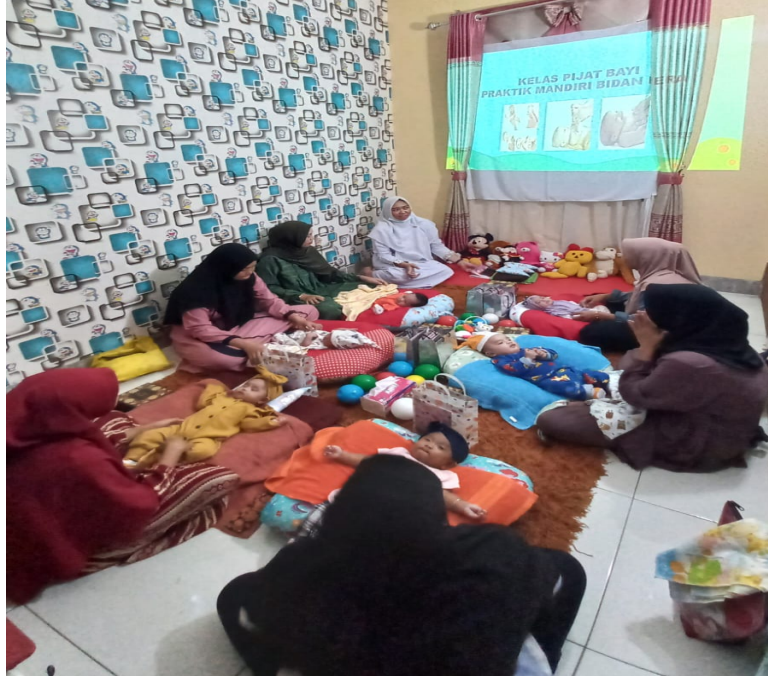
Gambar 1 Kegiatan Pemberian Pengetahuan Teknik Pijat Bayi Melalui Modul