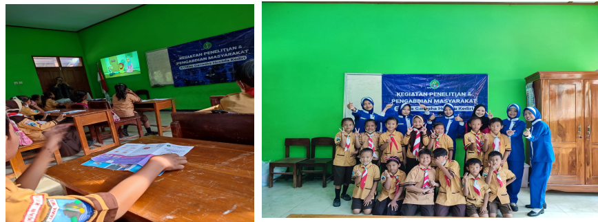
Gambar 2. Pelaksanaan Pengabdian Gerakan Masyarakat