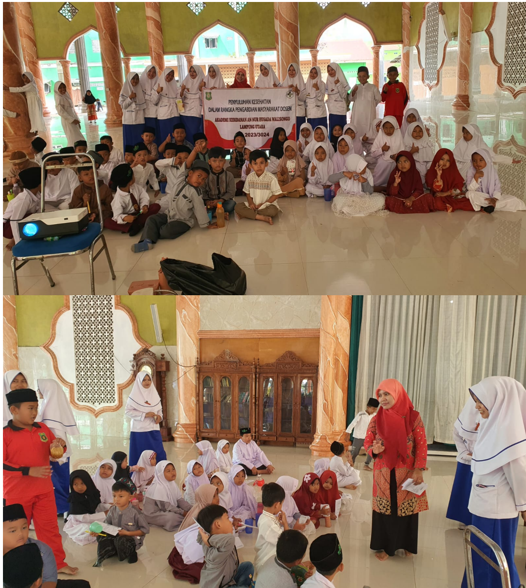
Gambar 1 Pemberian Edukasi PHBS