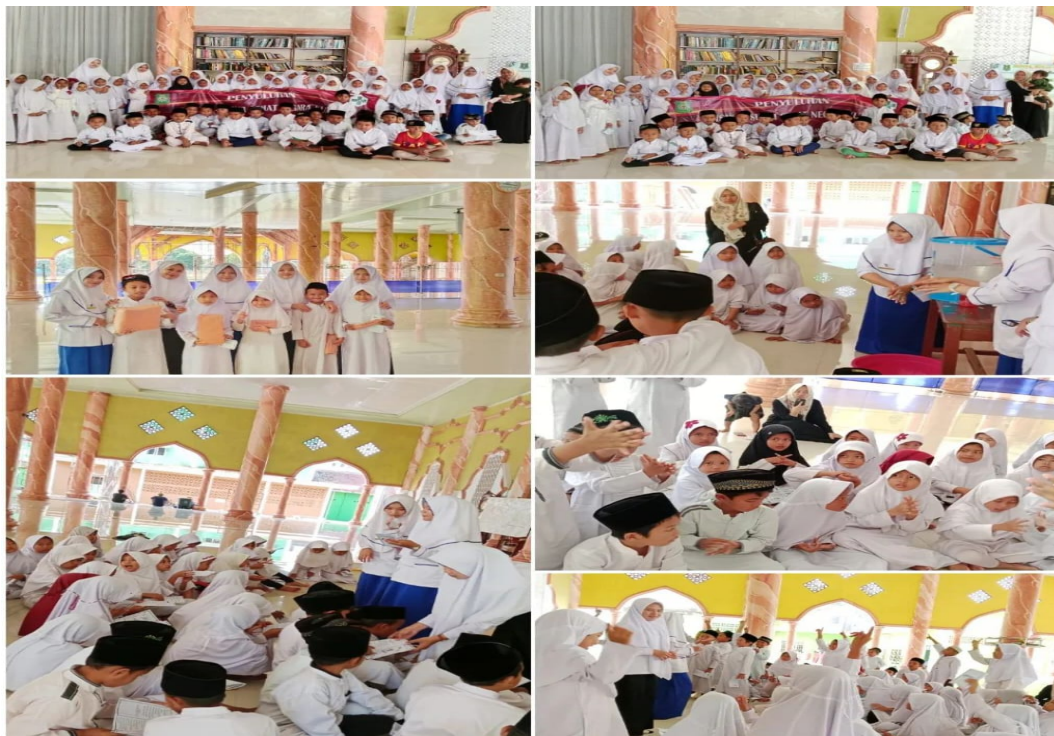
Gambar 2 Evaluasi Tanya Jawab

Namun, penelitian ini memiliki kelemahan karena tidak menyajikan data tentang peningkatan masing-masing media terhadap pengetahuan, sikap, dan perilaku pencegahan penyakit diare. Sikap melibatkan beberapa tahapan, seperti menerima, menjawab, menghargai, dan bertanggung jawab. Adapun media yang menarik dapat memengaruhi tingkat pengetahuan santri dan pada gilirannya, berdampak pada sikap mereka. Dalam penelitian ini, terdapat peningkatan sikap responden setelah mendapatkan edukasi PHBS dan higiene diri terkait pencegahan penyakit diare dengan menggunakan berbagai media. Penemuan ini konsisten dengan konsep sikap yang menurut Kara (2020) melibatkan perubahan mendasar dalam perilaku setelah penerimaan informasi melalui media yang beragam. (12)