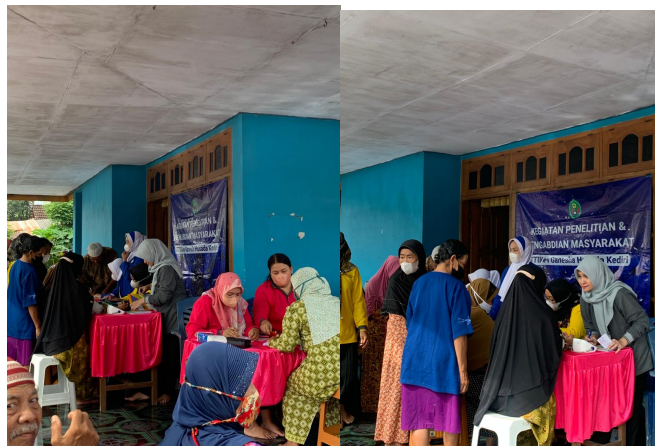
Gambar 2. Pelaksanaan Pengabdian Gerakan Masyarakat Cerdas Menggunakan Obat

Masyarakat juga diberikan informasi mengenai waktu penggunaan obat, penyimpanan dan cara membuang obat kadaluarsa yang baik dan benar. Setelah penyampaian materi, dilakukan CBIA dan perwakilan peserta diminta untuk menyampaikan hasil diskusinya. Pada akhir kegiatan penyuluhan, pesertadimintamengisi lembar post-test untuk mengetahui peningkatan pengetahuan dan pemahaman peserta dalam penggunaan obat yang tepat. Hasil pelaksanaan ini diharapkan dapat meningkatkan pemahaman yang baik pada peserta dan untuk dapat mensosialisasikan dengan serius dan berkelanjutan sebagai salah satu cara dalam meningkatkan pemahaman penanganan obat yang tepat di masyarakat ataupun di keluarga masing-masing.