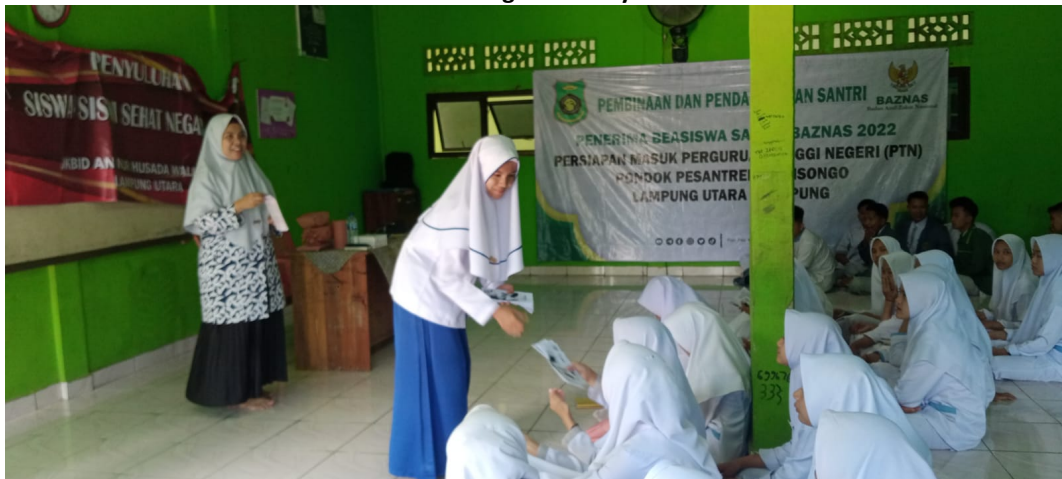
Gambar 2. Kegiatan Penyuluhan

Wulandari et al. (2021) melakukan studi di sebuah sekolah menengah di Indonesia untuk meningkatkan keterampilan pemeriksaan payudara sendiri (BSE) pada remaja putri. Tim pengabdian masyarakat mengimplementasikan serangkaian kegiatan yang meliputi sosialisasi awal, edukasi, pelatihan, dan praktik mandiri. Kegiatan-kegiatan ini melibatkan penyampaian informasi tentang BSE, penjelasan teknik palpasi, dan panduan praktis mengenai anatomi payudara serta mengenali gejala yang mencurigakan. Melalui dokumentasi berupa foto dan rekaman audio atau video, kegiatan-kegiatan tersebut terdokumentasi dengan baik untuk evaluasi dan penelitian di masa depan. 10