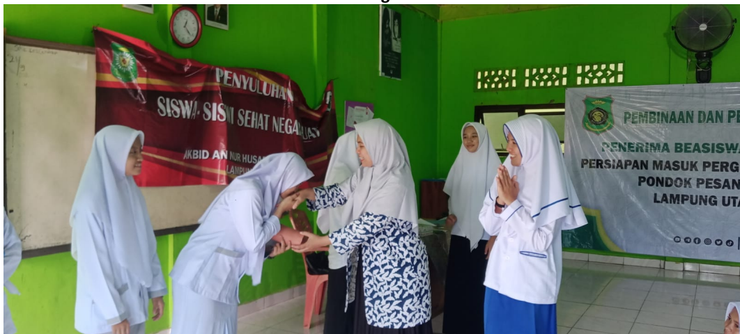
Gambar 3. Kegiatan Evaluasi