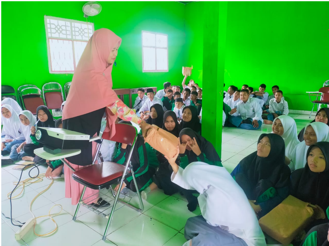
Gambar 3. Evaluasi Tanya Jawab

juga menunjukkan peningkatan dalam kesadaran tentang pentingnya praktik kesehatan reproduksi yang aman dan bertanggung jawab. Temuan ini sejalan dengan kegiatan pengabdian masyarakat yang melibatkan modul pendidikan seksual yang komprehensif, diskusi kelompok, dan evaluasi untuk meningkatkan pengetahuan remaja tentang kesehatan reproduksi dan kesadaran akan praktik kesehatan reproduksi yang aman. 8