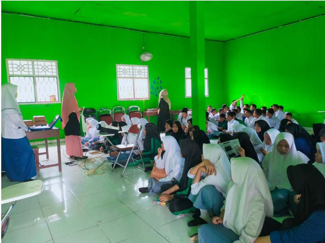
Gambar 2 Pemberian Edukasi Kebidanan