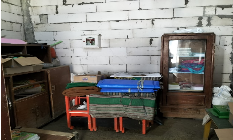
Gambar 1. Kondisi Awal Ruang UKS

Lingkungan kehidupan sekolah yang sehat merupakan satu unsur yang harus ada, dibina, dan dikembangkan terus agar pendidikan mencapai hasil yang diharapkan(2). Harapan dari pelaksanaan UKS di lembaga Taman Kanak-Kanak adalah sekolah memiliki lingkungan yang hijau, bersih, dan sehat, sehingga peserta didik menjadi nyaman mengikuti kegiatan pembelajaran. Jadi kalau peserta didik nyaman, semangat dalam belajar dan bermain, tentu bukan hanya perubahan perilaku yang kita dapatkan tetapi peserta didik juga semakin berprestasi. Melalui program penerapan dan pengembangan UKS, peserta didik dapat terbentuk perilaku hidup hijau, bersih, dan sehat. Peserta didik berprestasi dan sekolahnya juga berprestasi yang bertujuan mewujudkan warga sekolah bertanggungjawab dalam perlindungan dan pengelolaan lingkungan hidup, melalui tata sekolah yang baik untuk mendukung pembangunan berkelanjutan. Tujuan pengabdian masyarakat ini adalah pendampingan untuk mengoptimalkan UKS di TK Baitul Huda, Dusun Krobyokan, Desa Jedong, Wagir, Malang.