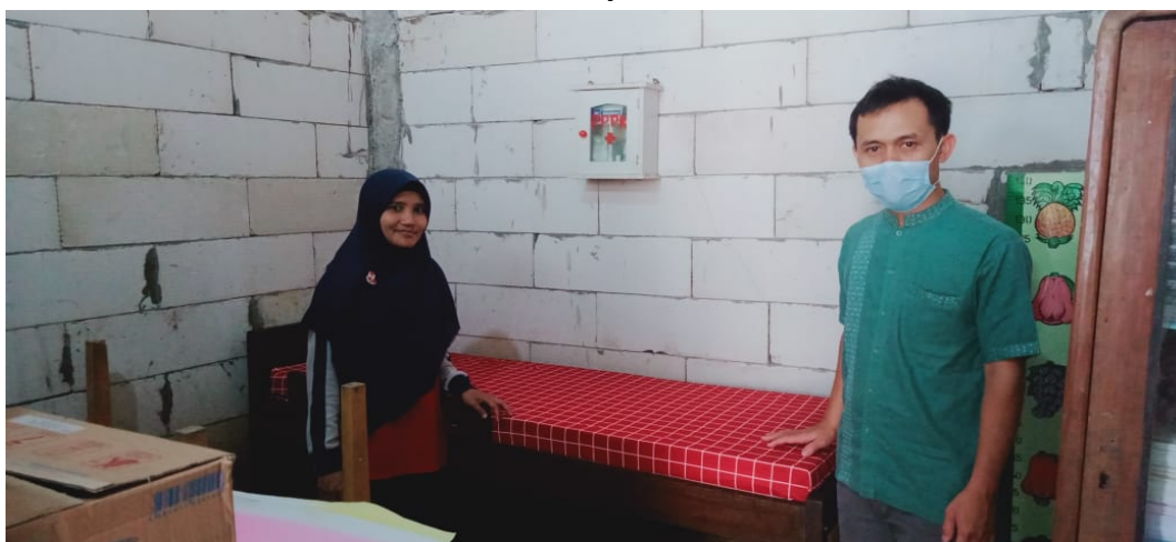
Gambar 4. Kondisi Ruang dan Perlengkapan UKS setelah Kegiatan Pengabdian Masyarakat

Hasil identifikasi pelaksanaan Trias UKS didapatkan pelaksanaan pendidikan dan penyuluhan kesehatan di sekolah termasuk dalam kategori kurang; pelaksanaan pelayanan kesehatan termasuk dalam kategori kurang; dan pelaksanaan lingkungan sekolah yang sehat termasuk dalam kategori kurang. Hal ini ditunjukkan berdasarkan tujuh pernyataan pada aspek lingkungan kehidupan sekolah yang sehat terdapat rata-rata 3,5; tujuh pernyataan pendidikan atau penyuluhan di sekolah terdapat nilai rata-rata 3,25; dan tujuh pernyataan pelayanan kesehatan sekolah terdapat nilai rata-rata 2,5.