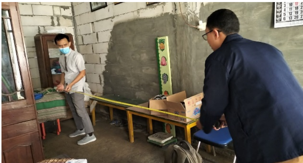
Gambar 3. Pembuatan Tempat Tidur untuk Pemeriksaan

Selain tempat tidur untuk pemeriksaan, diperlukan pengembangan alat kesehatan untuk menunjang pelaksanaan pelayanan kesehatan di sekolah. Perlengkapan UKS yang dikembangkan terdiri dari tempat tidur untuk pemeriksaan, perlengkapan P3K, alat pengukur tinggi badan, dan timbangan berat badan (Gambar 3). Standard Ruang UKS pada umumnya setiap sekolah baik PAUD, sekolah dasar, sekolah menengah pertama dan sekolah menengah atas diwajibkan memiliki satu ruangan khusus yang digunakan untuk melakukan perawatan kesehatan bagi siswa dan siswinya. Ruang kesehatan ini biasanya disebut dengan ruang UKS (usaha kesehatan sekolah) yang difungsikan untuk merawat siswa ketika dalam kondisi lemah seperti tiba-tiba jatuh sakit karna kelelahan saat pelaksanaan upacara atau akibat terluka saat berada disekolah seperti saat melakukan pelajaran olah raga dan bermain. Ruang UKS disekolah