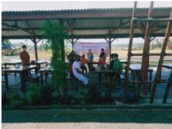
Gambar 2 Edukasi Penerapan Protokol Kesehatan

Gambar 2 menunjukkan kegiatan edukasi dalam bentuk penyuluhan dan demonstrasi tentang penerapan protocol kesehatan di lokasi wisata. Setelah penyampaian materi, dibuka sesi diskusi dan peserta antusias mengajukan pertanyaan serta mendemonstrasikan ulang pemakaian masker, cara cuci tangan, dan pengaturan kursi pengunjung lokasi wisata.